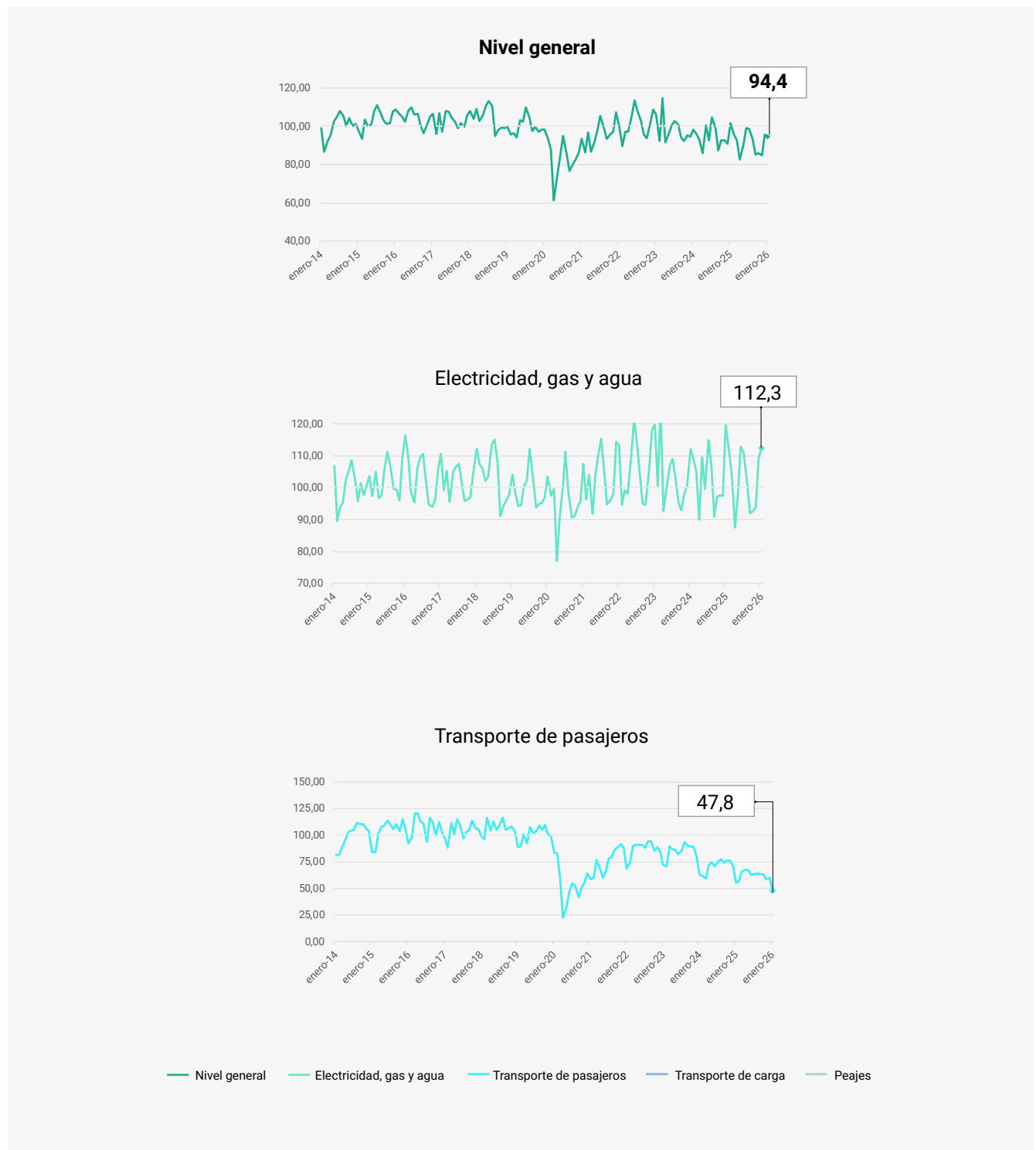
Gráfico 2. Índice de servicios públicos de la provincia de Santa Fe Serie original. Números índices, base 2014=100. Enero 2014-enero 2026